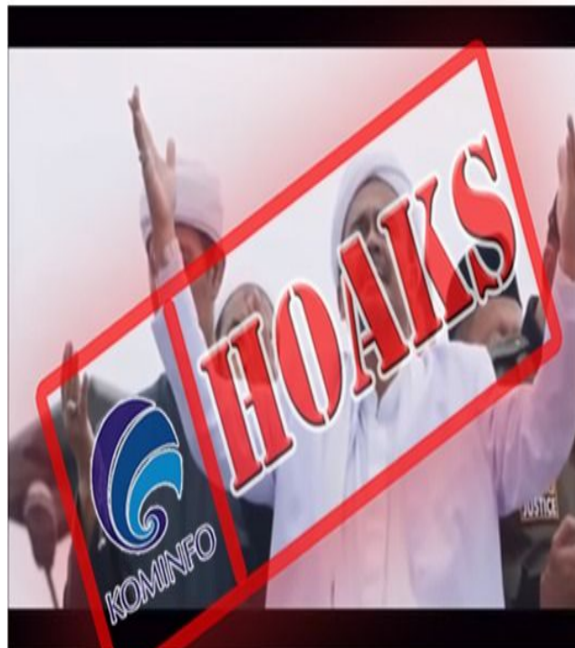
Pesan Terbaru Habib Rizieq Shihab Langsung Dari Kota Mekkah